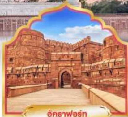
อัคราฟอรัท