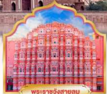
พระราชวังสายลม