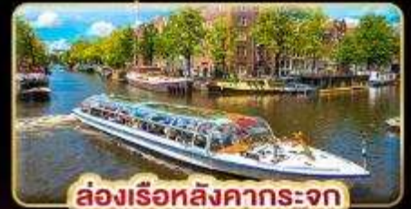
ล่องเรือหลังคากระจุก