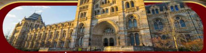
พิพิธภัณฑ์ประวัติศาสตร์โลกทางธรรมชาติ