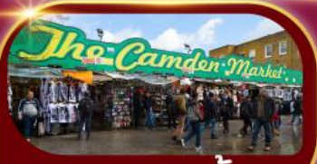
ตลาดแคมเดน