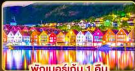
พักเบอร์เกน 1 คืน