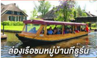
ล่องเรือชมหมู่บ้านกังหัน