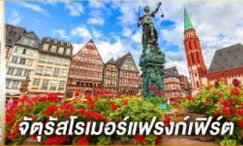
จัตุรัสโรเมอร์เฟรงก์เฟิร์ต