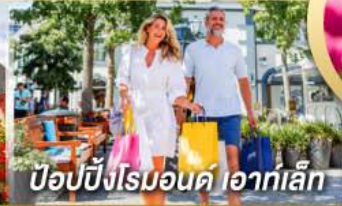
ป๊อปบิงโรมอนด์ ไอท์เล็ก