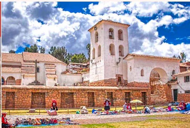
เที่ยง บริการอาหารกลางวัน ณ ภัตตาคาร Hanka Restaurant