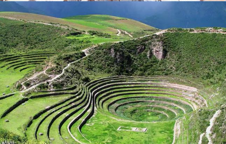
บ่าย นำท่านเดินทางสู่ มาราซ (Maras) แหล่งผลิตเกลือที่คุณภาพดีที่สุดในโลก ที่มีมาตั้งแต่สมัยอินคา แวนาชันบันไดที่เรียงอยู่ตามลำดับความสูงของภูเขา จากนั้นเดินทางสู่ โมเรย์ (Moray) นาขั้นบันไดวงกลมขนาดใหญ่หลายๆรูปร่างแปลกตาที่ชาวอินคาทำไว้เพื่อทดลองปลูกพืชพันธุ์ต่างๆ จากจุดนี้สามารถมองเห็น หมู่บ้านอุรัมบัмба (Urubamba) ได้อีกด้วย ได้เวลาเดินทางกลับสู่เมือง เมืองคัสโก (Cusco) เมืองหลวงของอาณาจักรอินคา ที่แพร่ขยายอำนาจจนกินพื้นที่ 1 ใน 3 ของอเมริกาใต้ ตั้งอยู่เหนือระดับน้ำทะเลถึง 3,400 เมตร และเป็นแหล่งอารยธรรมยุคก่อนประวัติศาสตร์ที่ลึกลับน่าทึ่ง เป็นชุมชนเก่าแก่ของจักรวรรดิอินคาอันรุ่งเรือง ซึ่งยังคงทิ้งร่องรอยความเจริญไว้ให้เห็นเป็นซากปรักหักพังโบราณและโบราณวัตถุต่างๆ