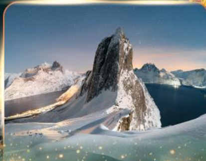
เกาะเซนญา