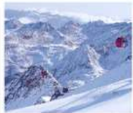
ภูเขาหิมะต่ากู่ปิงชวน