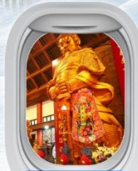
วัดชางหมิว