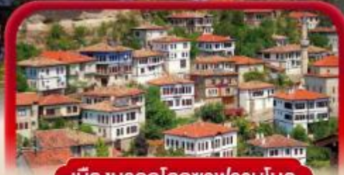
เมืองมรดกโลกชาฟรานโกส