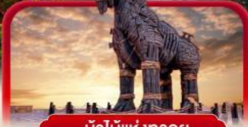
ม้าไม้แห่งทรอย