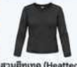
สวมฮีตเทค (Heattech) แบบหนาพิเศษด้านใน