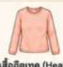
สวมเสื้อฮีตเทค (Heattech) ไว้ด้านในเพื่อเพิ่มความอบอุ่น แทนการใส่เสื้อหนาๆ หลายชั้น