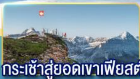
กระเช้าสู่ยอดเขาเฟียสท์