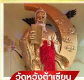
วัตต์ห้วงต้าเซียน