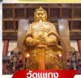
วัตต์แชกง