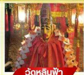
วัตต์หลินฟ้า