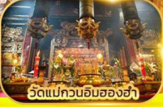
วัดแม่กวนอิมสองอ่า