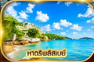
หาดริพลีสเบย์