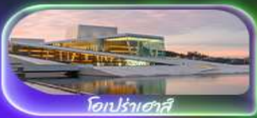
โอเปร่าเฮาส์