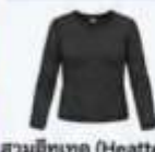
สวมฮีทเทค (Heattech) แบบหนาพิเศษด้านใน