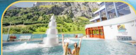
แช่น้ำแร่ร้อนผ่อนคลายลวยคอร์บิค