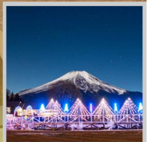
"YAMANAKAKO ILLUMINATION FANTASEUM"