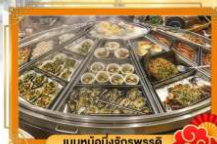
เมนูหม้อนึ่งจักรพรรดิ