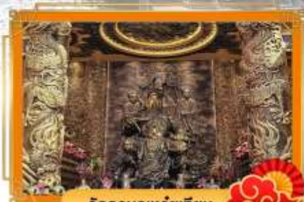
วัดกวนอูเหวยเทียน