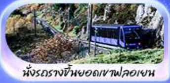
นั้งรถรางขึ้นยอดเขาฟลอยอน

เปิดประสบการณ์สุดว้าว... สักครั้งในชีวิต! ล่องเรือชมฟยอร์ด นั่งรถไฟสายโรแมนติกฟลอยอนข้ามน้ำ เบอร์กิน ชมเมืองท่าบรีคเกน นั่งรถรางขึ้นยอดเขาฟลอยอนชมวิวเมือง ไมควรพลาตั่ง Cable car ขึ้นยอดเขาอูลริเคน ชม Top view ตระการตา ความอลังการระดับมาสเตอร์พีซ จุดชมวิวดัสตากาสดัน เดินเล่นตลาดปลาเบอร์กิน ขึ้นชมโบสถ์ออสโลเยี่ยมชมโอเปร่าเฮาส์ มหาวิหารออสโล ป้อมปราการอาครส์ฮูส รัฐสภาแห่งนอร์เวย์ สวนอนุสรณ์ชาติ Vigeland Sculpture Park ซุปป์ิงถนน Karl Johans gate