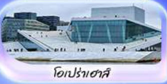
โอเปร่าเฮาส์

เดินทาง 07-15 ต.ค.69 / 16-24 ต.ค.69 13-21 พ.ย. 69 / 04-12 ธ.ค. 69 25 ธ.ค. 69 - 02 ม.ค. 70 (ปีใหม่)