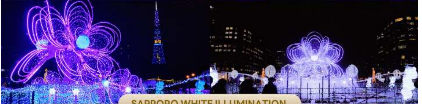
SAPPORO WHITE ILLUMINATION