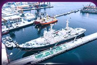
เรือตัดน้ำแข็งเลนิน