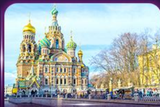
โบสถ์แห่งหยดเลือด