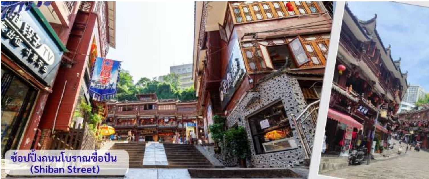
ช้อปปิ้งถนนโบราณช้อปปิ้ง (Shibanshi Street)

จากนั้นนำทุกท่าน เดินถนนโบราณ Feng Hueng Ancient Town ที่ถนนช้อปปิ้ง Shibanshi Street เมืองที่ยังคงรักษาเอกลักษณ์ความเป็นพื้นเมืองผสมผสานกับยุคปัจจุบันเอาไว้ได้อย่างลงตัววิถีชีวิตของชาวบ้านที่อาศัยอยู่ที่นี้ บรรยากาศในเมืองเฟิงหวง ถนนเก่าช้อปปิ้งเป็นถนนปูหินแคบๆ กว้างไม่ถึง 5 เมตร ทอดยาวจากทางเข้าวัดเต้าเหมินไปทางทิศตะวันตก ผ่านถนนหลายสาย ได้แก่ ถนนครอส ถนนเจิ้งตะวันออก ถนนเจิ้งตะวันตก ศาลาสูยหลง หียงเซียวซง เต้าซ่านลา ศาลาเจียกั๋ว และสุสานเงินฉงเหวิน สุดท้ายจะนำไปสู่ “น้ำพุแรกใต้ฟ้า” ถนนสายนี้มีความยาวกว่า 3,000 เมตร และเป็นย่านการค้าที่คึกคักที่สุดในเฟิงหวง