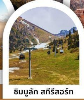
ซิมบูลัก สกีรีสอร์ท