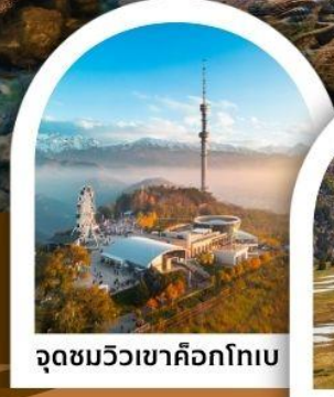
จุดชมวิวเขาค็อกโทเบ