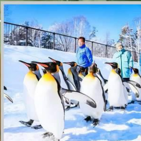
“PENGUIN ASAHIYAMA ZOO”