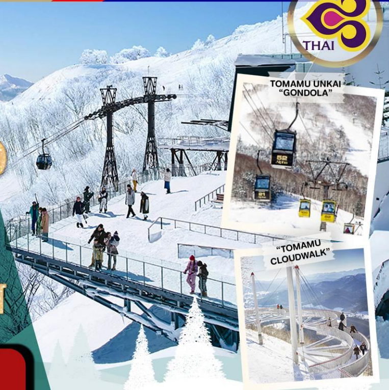
TOMAMU UNKAI "GONDOLA"