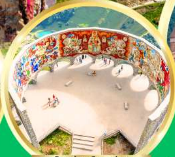
Russian-Georgian Friendship Monument