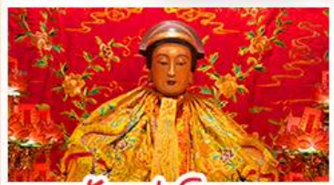
วัดเล่งโง้ว