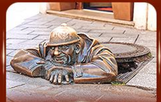
แลนด์มาร์คดัง รูปปั้นนักรบ ปรากติสลาวา