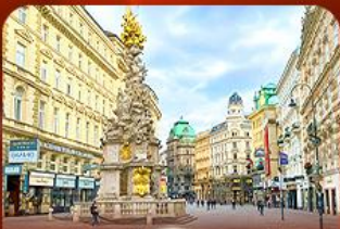
คาร์ดินัล สตรีท ออสเตรีย