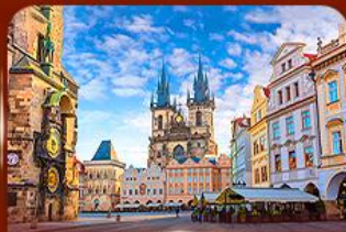
ชมย่านเมืองเก่า ปราก