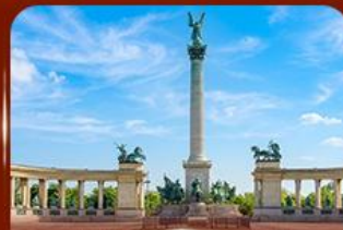
จัตุรัสวีรบุรุษ บูดาเปสต์