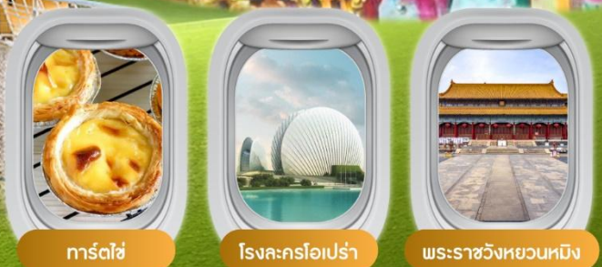
ทาร์ตไข่ โรงละครโอเปร่า พระราชวังหยวนหมิง