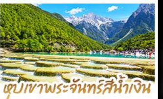
เขุบเขาพระจันทร์สีน้ำเงิน