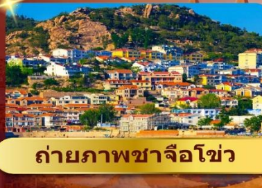
ถ่ายภาพซาจือໂ໑ว