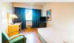
Single สำหรับ 1 ท่าน