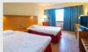
Twin สำหรับ 2 ท่าน