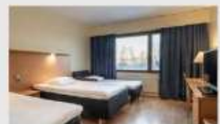
Triple สำหรับ 3 ท่าน