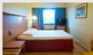
Double สำหรับ 2 ท่าน