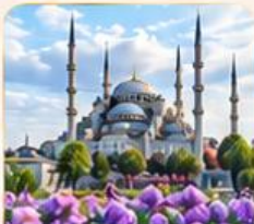
BLUE MOSQUE สุเหร่าสีน้ำเงิน