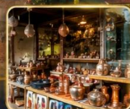
เลือกซื้อของฝากงานหัตถกรรมพื้นเมือง

สัมผัสเสน่ห์แห่งอดีตในเมืองที่เวลาเดินช้าลง กับสถาปัตยกรรมอันงดงาม วัฒนธรรมที่ยังคงมีชีวิต และความอบอุ่นจากผู้คน