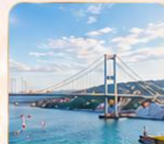
BOSPHORUS STRAIT ช่องแคบบอสฟอรัส