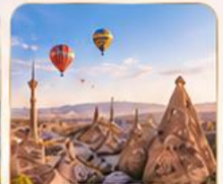
CAPPADOCIA คัปปาโดเกีย

VIP บริการเหนือระดับ • เช็กอินสะดวก • บริการช่วยเหลือ ใ้ใจทุกขั้นตอน