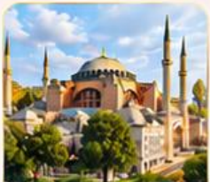
HAGIA SOPHIA โบสถ์เซนต์โซเฟีย