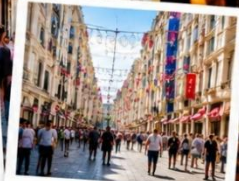
ISTIKLAL STREET (Grand Avenue of Pera) ถนนสายช้อปปิ้ง ยืน 88 ครอบคลุมในทีเดียว