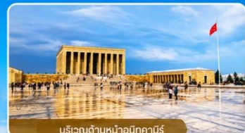
บริเวณด้านหน้าอนีกาบิร์

สถานที่สำคัญที่คนตุรกีให้ความเคารพและจดจำผู้นำผู้ยิ่งใหญ่ ที่อุทิศทั้งชีวิตเพื่อชาติ ศาสนา และประชาชน