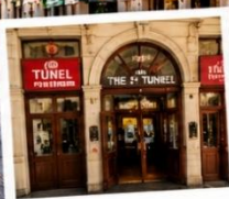
สถานีทูนเนล (TUNEL STATION) สถานีรถไฟใต้ดินสายเก่าแก่และเป็นหนึ่งในระบบขนส่งที่เก่าแก่ที่สุดในโลก