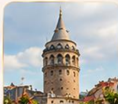
GALATA TOWER หอคอยกาลาตา