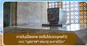
ภายในมีโลงศพ (แต่ไม่ได้รับอนุญาตให้ดู) ของ "มุสตาฟา เคมาล อะตาเติร์ก"