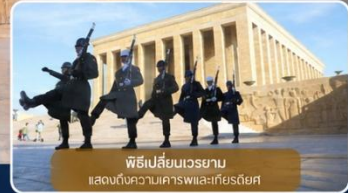
พิธีเปลี่ยนเวรยามแสดงต้นแบบเคารพและเกียรติยศ

ได้เวลาเดินทางทางสู่อำเภอ "ซาฟรานโบลู" (Safranbolu) คือเมืองท่องเที่ยวที่มีชื่อเสียงของจังหวัดการาบึค (Karabük) ในภูมิภาคทะเลดำตุรกี เป็นเมืองที่มีความสำคัญทางด้านประวัติศาสตร์ของประเทศ ตุรกี โดยเฉพาะชื่อเสียงเกี่ยวกับสถาปัตยกรรมซาฟรานโบลู ที่มีอิทธิพลต่อพัฒนาการชุมชนเมืองทั่วทั้งจักรวรรดิออตโตมัน ต่อมาในปี 1994 เมืองซาฟรานโบลู ได้ถูกองค์การยูเนสโกยกให้เป็นมรดกโลกทางด้านวัฒนธรรม