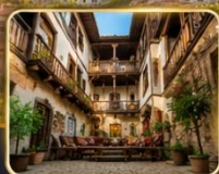
บ้านเรือนสไตล์ออตโตมันอายุกว่า 200 ปี

เมืองท่องเที่ยวที่มีชื่อเสียงของจังหวัดการาบึค (Karabük) ในปี 1994 เมืองซาฟรานโบลู ได้ถูกองค์การยูเนสโกยกให้เป็น มรดกโลกทางด้านวัฒนธรรม