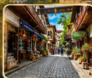
เดินเล่นย่านเมืองเก่าบรรยากาศย้อนยุค