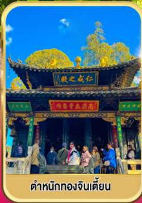
ตำหนักทองจีนเตียน