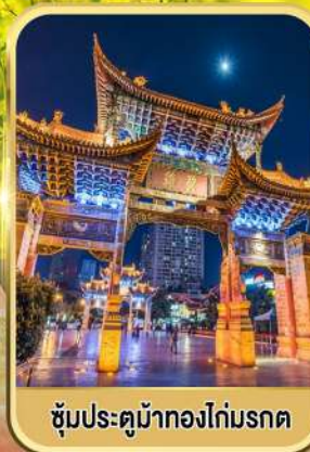
ซุ้มประตูม้าทองไถ่มรดก