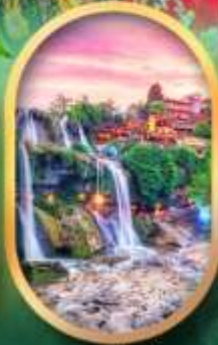
ฟูหลงเจิ้นน้ำตก