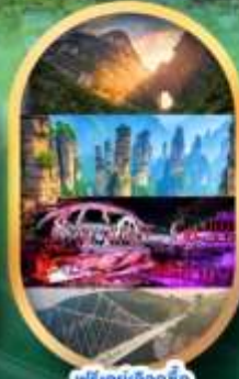
ฟรีคีย์เลือกซื้อ Option เสริม