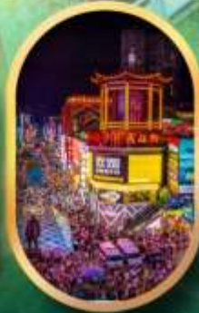
ถนนคนเดินซิงสู่