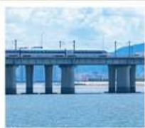
นั่งรถไฟใต้ดินข้ามทะเล