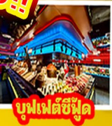
บูฟเฟต์ซีฟู้ด