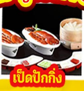
เปิดปิ้งกั๊ง