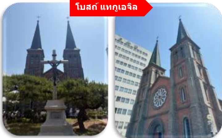
โบสถ์ แทกูเจิล

นำท่านเที่ยวชม โบสถ์แทกูเจิล โบสถ์นิกายโปรเตสแตนต์ที่เก่าแก่ที่สุดใน จังหวัดคยอซังบุก (Gyeongsangbuk-do) ตั้งอยู่ในบริเวณ Cheongna ซึ่งเป็นย่านที่อยู่อาศัยของเหล่ามิชชันนารีที่มาอาศัยอยู่ใน เมืองแทกู