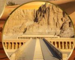
หุบเขากษัตริย์