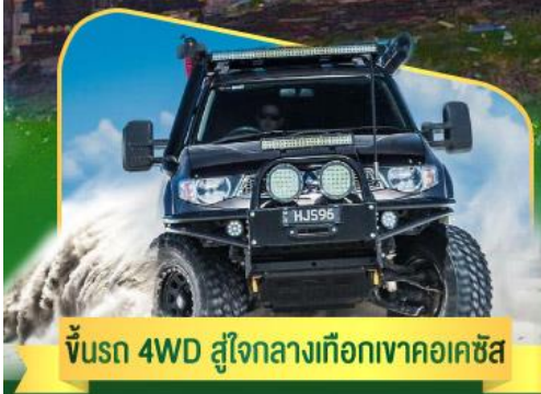
คันรถ 4WD สู้อีกกลางเทือกเขาคอเคซัส