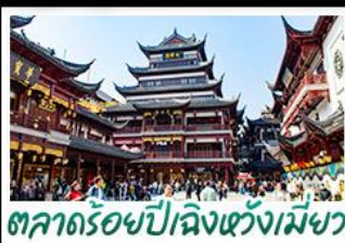
ตลาดร้อยปีเฉิงหวงเมี่ย