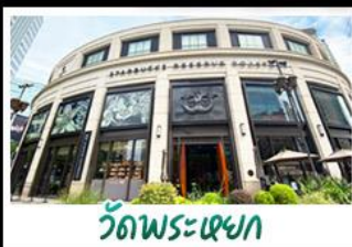
วัดพระหยก