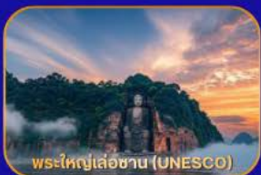
พระใหญ่เล่อซาน (UNESCO)

ล่องเรือชม "พระใหญ่เล่อซาน" - เมืองโบราณหวงหลงซี - แพนด้าเซลฟี - ห้างสมุดจงซูเก้อ - Wangjianglou Park - ถนนชุนซีลู่ (แหล่งซ้อป๋ิง) - IFS (แพนด้าปิ่นตึก) - วัดต้าเจ้อ