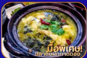
มีอพิเศษ! ปลาต้มผักกาดดอง