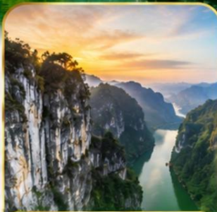
ล่องเรือ เขายายเที่ยง