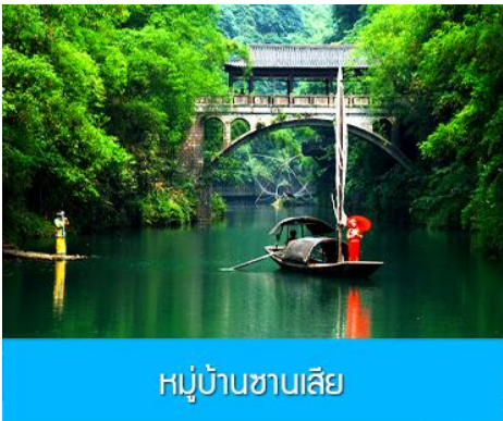
หมู่บ้านซานเสี