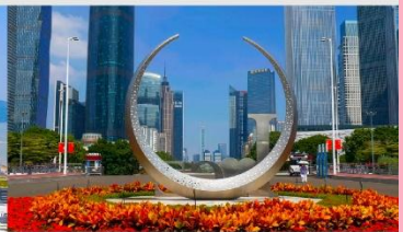
จัตุรัสฮั่วเจิง

*ทางบริษัทฯ ขอสงวนสิทธิ์ในการสลับโปรแกรมทัวร์ตามความเหมาะสมขึ้นอยู่กับสถานการณ์สำนักงาน โดยคำนึงถึงผลประโยชน์ของลูกค้าเป็นสำคัญ