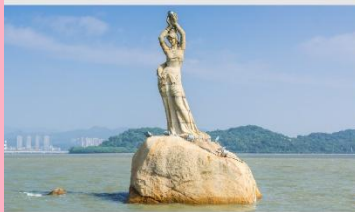
จู่ไห่พีชเชอร์เกิร์ล(หวิหนี่)