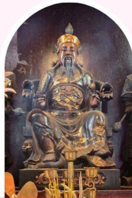
วัดปักโต เสริมโชคลาก นำพาความรุ่งเรือง