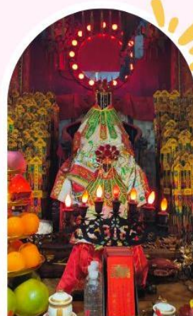
วัดเจ้าแม่กวนอิมอ่องอ่า ขอพรเรื่องเงิน ทรัพย์สิน และความมั่งคั่ง