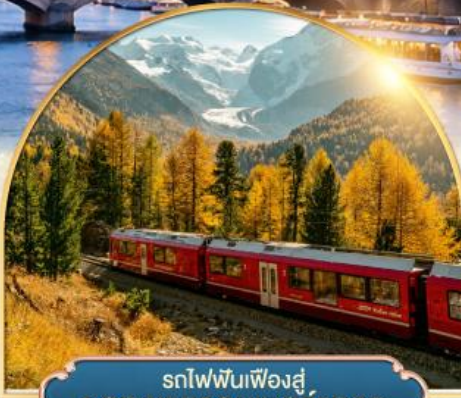
รถไฟฟันเฟืองสู่ ยอดเขากรอนเนอ์เกรต