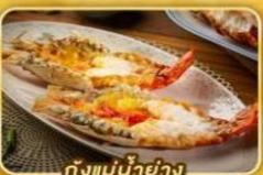
กุ้งแม่น้ำย่าง