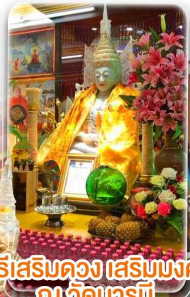
พิธีเสริมดวง เสริมมงคล ณ วัดบารมี

ได้เวลาอันสมควร ตามเวลานัดหมาย นำท่านเดินทางสู่ สนามบินเพื่อทำการเช็คอินเอกสารแก่ท่าน