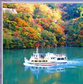
"SHOGAWA YURAN CRUISE"