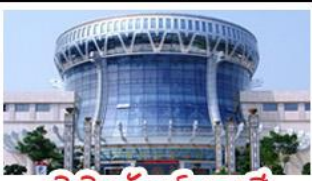
พิพิธภัณฑ์กังวานสี

สวนสนุก FANTASYLAND - หมู่บ้านสไตล์ยุโรป พิพิธภัณฑ์กังวานสี - ถนนคนเดินสามตรอกสองซอก ท่าเรือกิ่งจื่อ - ศาลเจ้าแม่กวนอิมพันกร เมนูพิเศษ อาหารกังวานตุ้ง , สุกีชาบูหม่าล่า